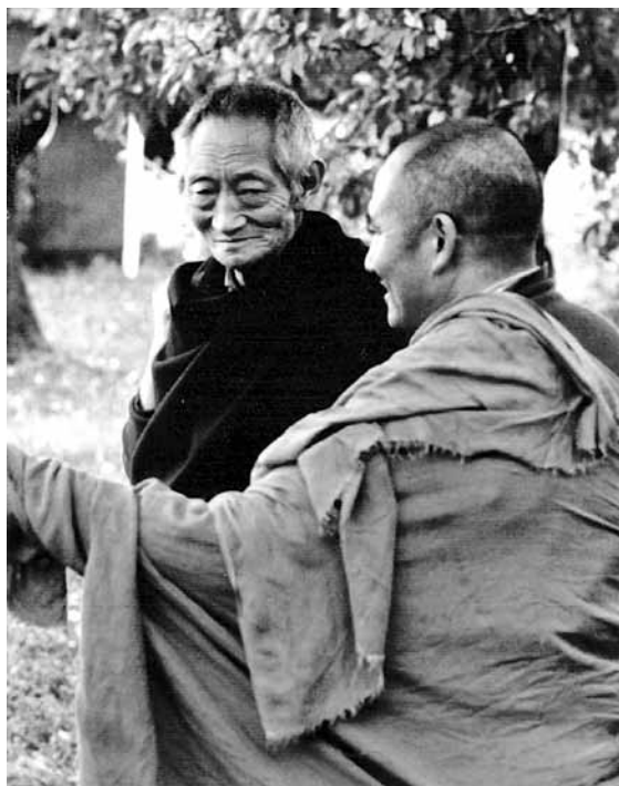
Kalu Rinpoche és Láma Ngawang Rinpoche 1980, Svédország

amely a Szkíta Bölcs Buddha tanítása, és 2500 év óta ugyancsak alapvető meghatározó szellemi erő Euráziában.