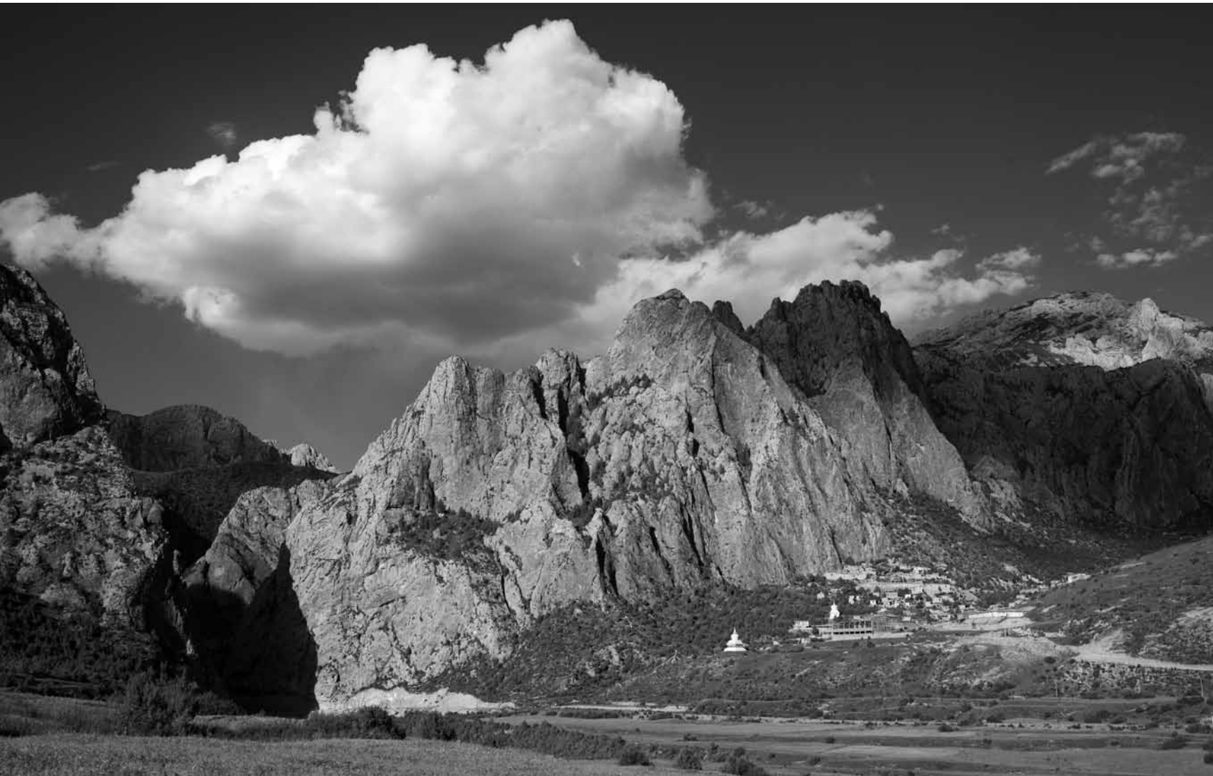
Buddha a Szkíta Bölcs

Általános tapasztalatunk, hogy amikor egy rémálomból felébredünk, az álomban oly valóságosan átélt szenvedésünk és fájdalmunk semmivé foszlik. Ez egyszerűen azért következik be, hogy visszagondolva az álomra, felismerjük, hogy az egész csak az elménk teremtménye volt. A szenvedésünk azonban valódi volt, ami annak volt köszönhető, hogy a tudatunk nem-dologi, anyagtalan teremtményeit – az álmképeket – kemény, dologi valóságnak tartottuk. Felébredve, a tudatunk rálát az egy fokkal zavarosabb álom állapotra, és felszabadító felismerésre jut annak természetéről. A tökéletesen felébredt állapot távlatából a tudat ehhez hasonló rálátást nyer a viszonylagos ébrenlétre. Felfedezi, hogy az is csak egy zavaros tudatállapot,