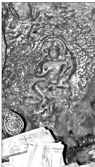
Sziklából természetes módon kinőtt Taraszobor Nepálban

ája, egy természetesen keletkező „ajándék”. Keletkezése okait Tai Szitupa így magyarázta: