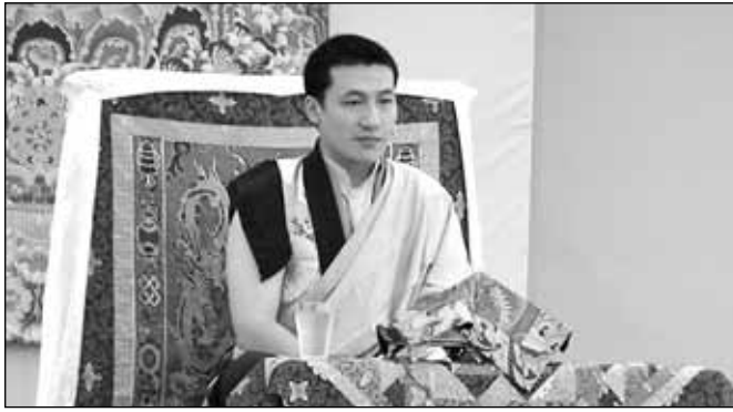
Hazánkban járt, tanított és meghatalmazást adott