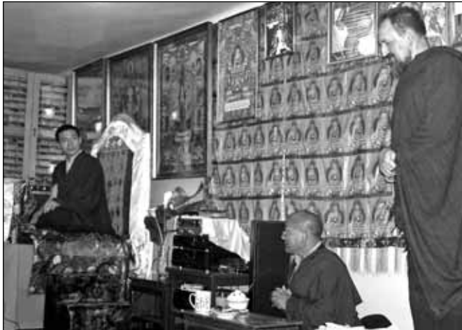
Tiszteletreméltó Láma Csöpel felkérte Őszentségét, hogy legyen közösségünk szellemi vezetője és védelmezője