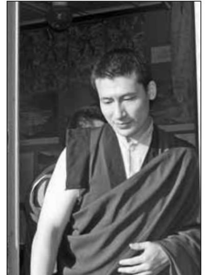
Megszentelte a Sztupát és a Kőrösi Csoma Sándor kiállítást