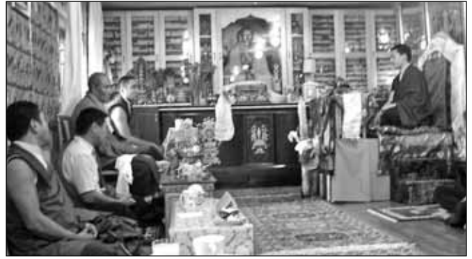
Felszentelte Taron a Kangyur és Tengyur köteteit