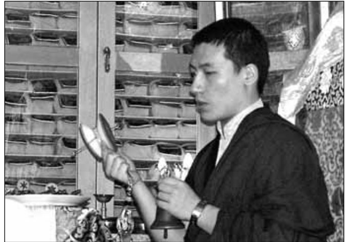
Karmapa Őszentsége vezetésével a Lámák Mahakala pudzsát csinálták